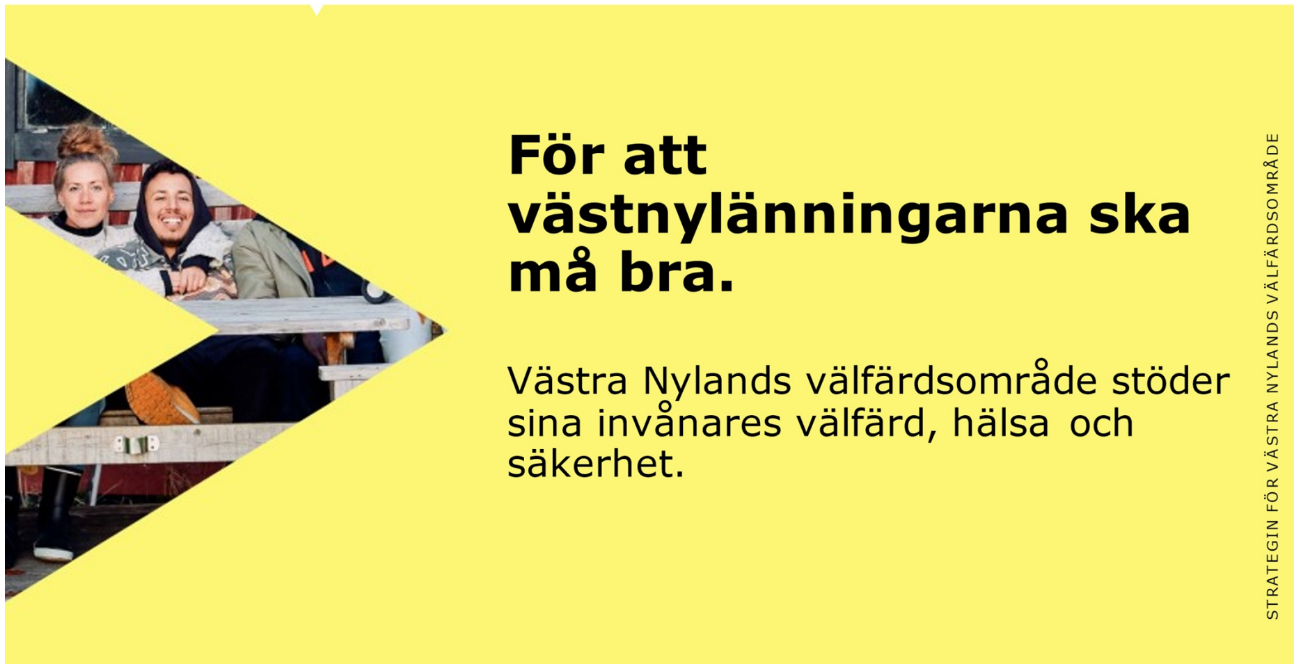
Bild. Välfärdsområdets grundläggande uppgift, som beskrivs i strategin för Västra Nylands välfärdsområde, är att stödja invånarnas välfärd, hälsa och säkerhet.