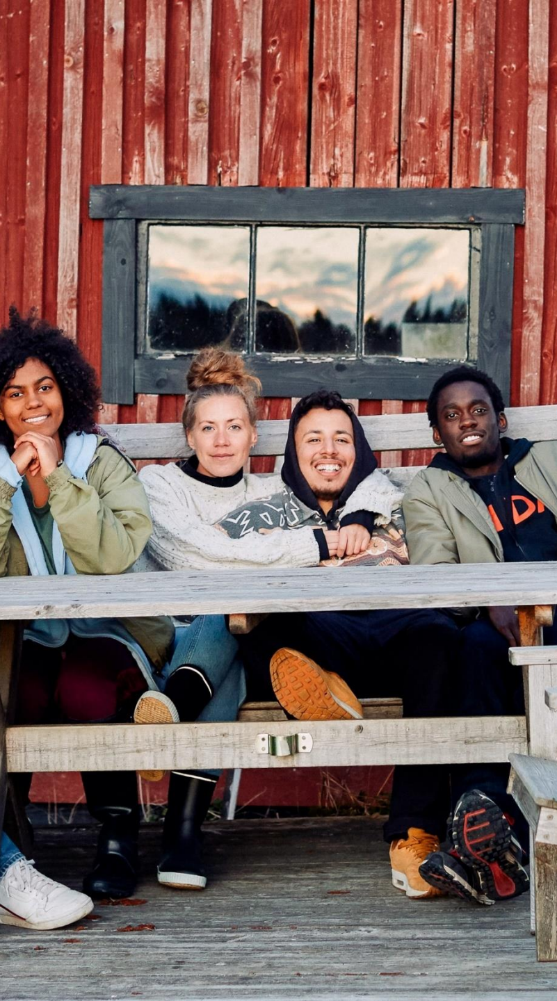
Kuva: Nuoret penkillä