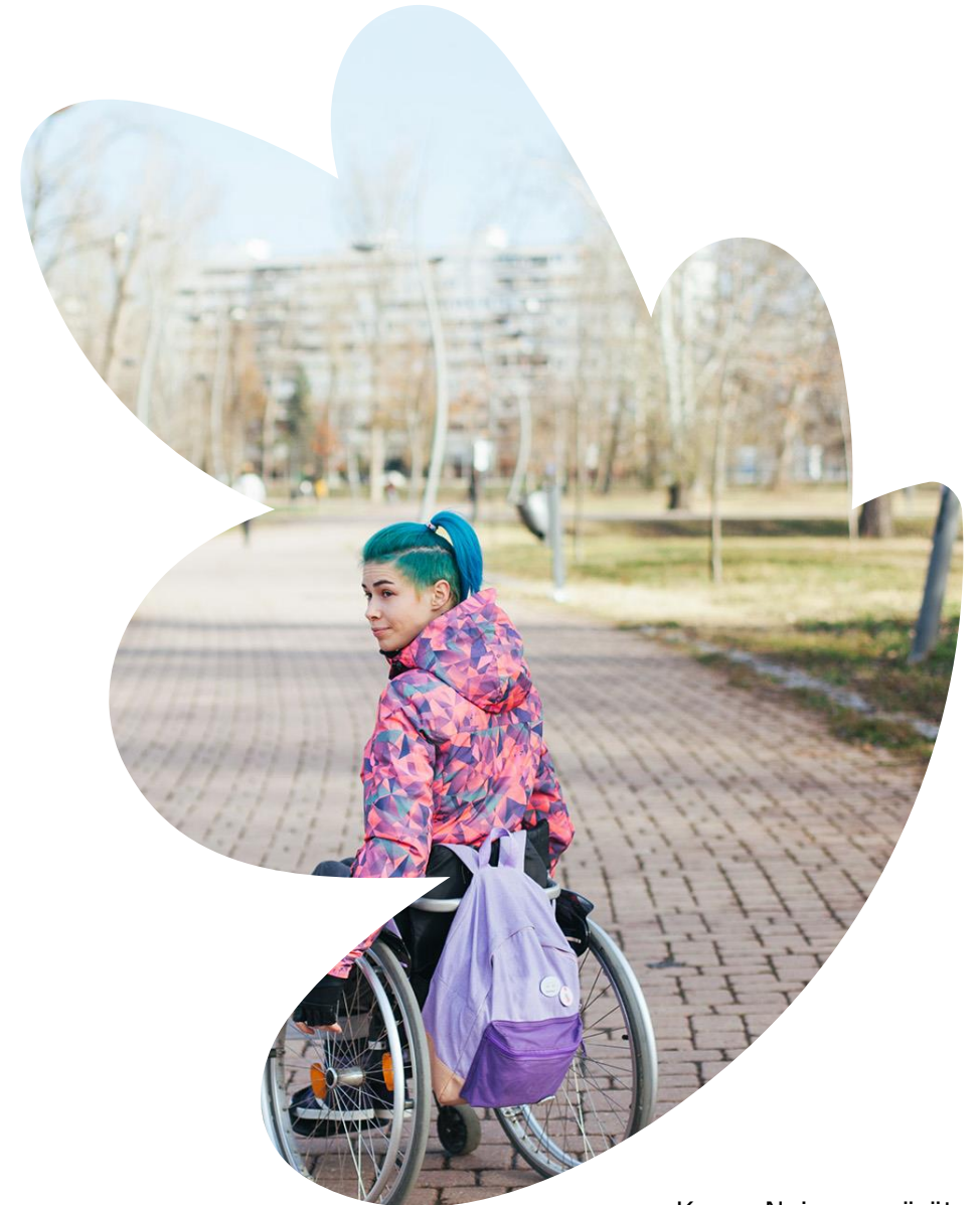
Kuva: Nainen pyörätuolissa