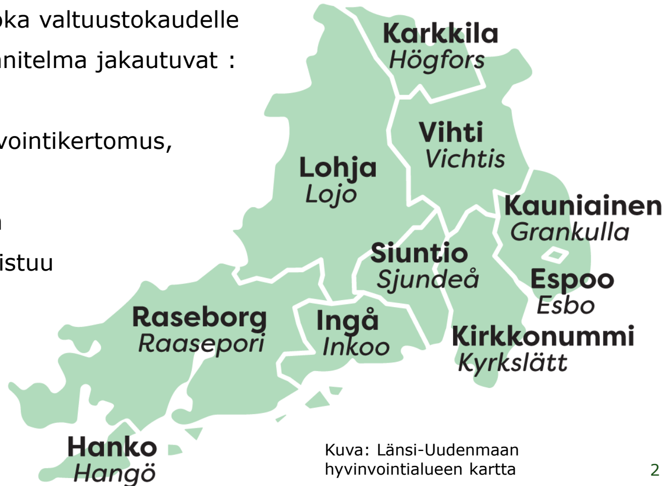
Kuva: Länsi-Uudenmaan hyvinvointialueen kartta

Kertomuksen perusteella laaditaan hyvinvointisuunnitelma, joka valmistuu alkuvuonna 2024.